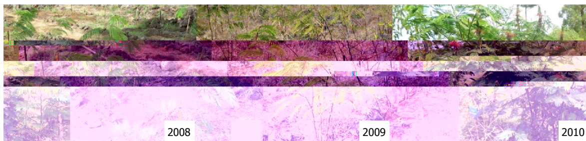
Gambar (Figure) 2. Perkembangan pertumbuhan C. calothyrsus ( Growth development of C. Calothyrsus )