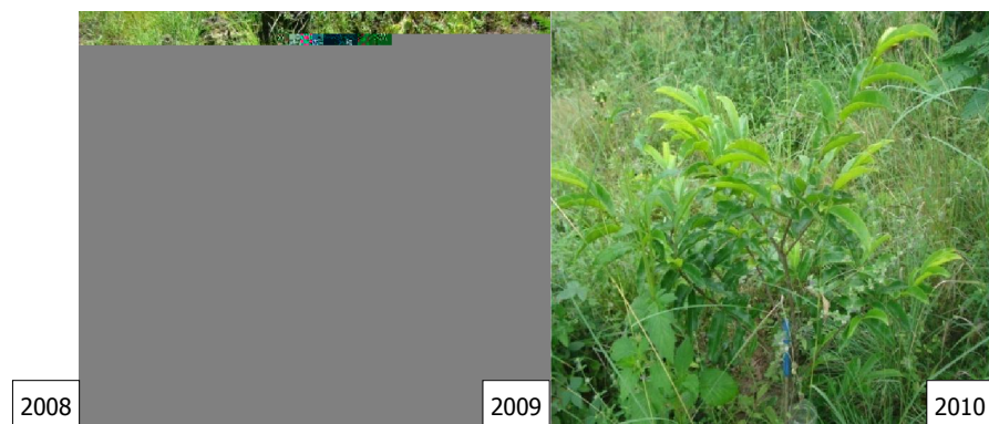
Gambar (Figure) 4. Perkembangan pertumbuhan A. bunius ( Growth development of A. bunius )

Buni ( Antidesma bunius (L.) Spreng.) dengan nama lokal buni (Melayu), wuni, atau huni (Sunda) tumbuh liar di daerah-daerah basah di India, Sri Lanka, Burma, dan Malaysia. Buni dapat