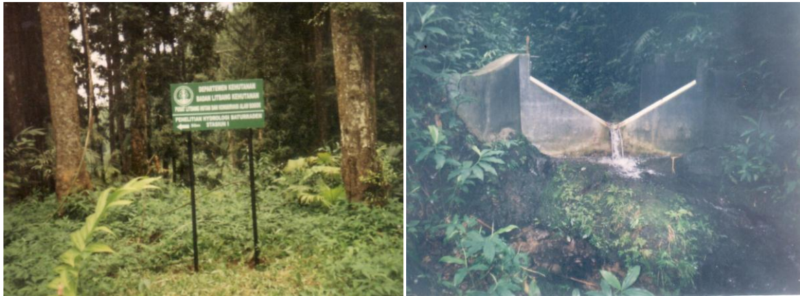
Gambar (Figure) 3. Stasiun hasil air 1 ( Water yield monitoring station 1 )