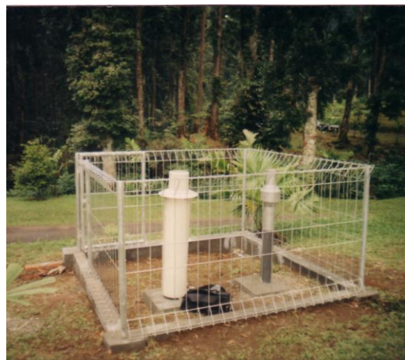
Gambar (Figure) 2. Stasiun pengamat curah hujan (Rainfall monitoring station)

Data yang berhasil dikumpulkan dengan prosedur di atas ditabulasi menjadi data bulanan dan tahunan. Setelah terkumpul menjadi data seri yang panjang (beberapa tahun), kemudian dianalisis secara deskriptif komparatif.