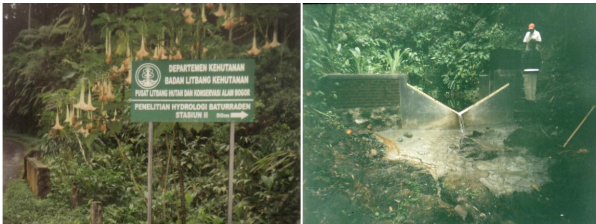
Gambar (Figure) 4. Stasiun pengamat hasil air 2 ( Water yield monitoring station 2 )