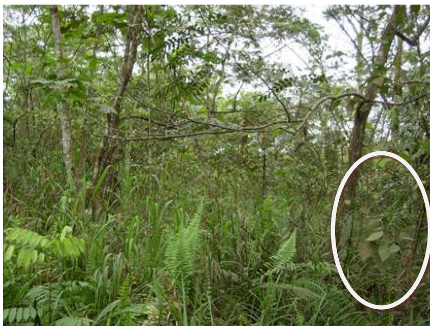
Gambar (Figure) 4. Anakan mahang di lokasi arboretum ( Macaranga seedling at arboretum )