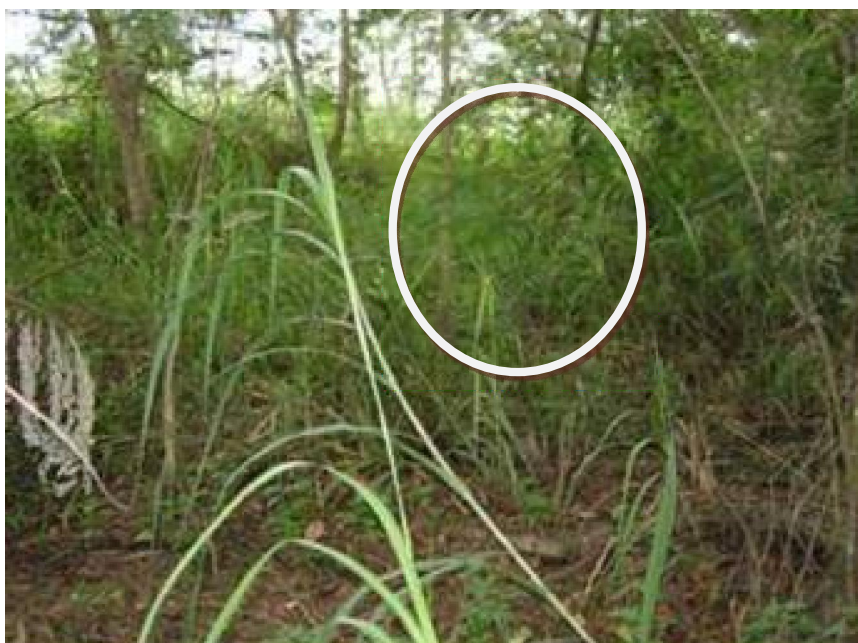
Gambar (Figure) 2. Tumbuhan pionir jenis kaliandra di lokasi penelitian ( Caliandra sp. pioneer vegetation at research location )