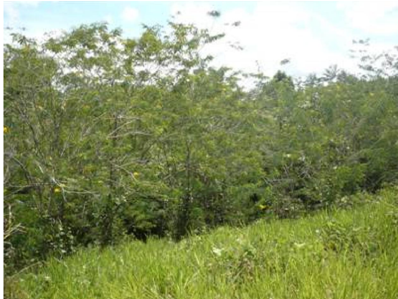
Gambar (Figure) 3. Permudaan jenis Clidemia hirta di hutan revegetasi ( Regeneration of Clidemia hirta in forest revegetation )