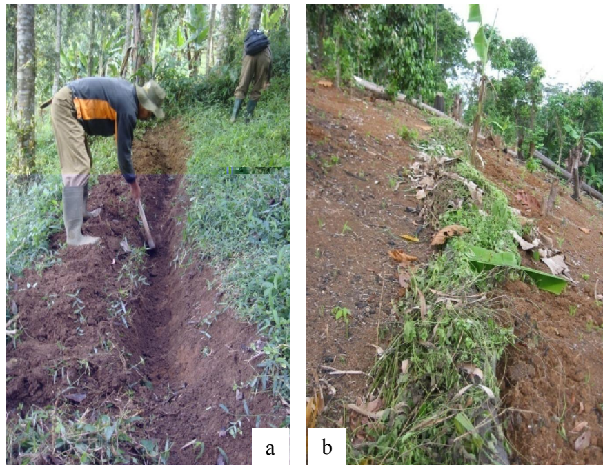
Gambar (Figure) 1. Pembuatan saluran mulsa vertikal ( Establishment of vertical mulch channel ) (a); saluran telah diisi mulsa ( channel has been filled by mulch ) (b)

Pengamatan plot erosi dilakukan selama satu tahun. Pengamatan erosi dan aliran permukaan dilakukan pada setiap kejadian hujan dengan mencatat curah hujan, jumlah air yang tertampung dalam bak, dan contoh air diambil dari air yang tertampung dalam bak.