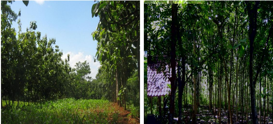
Gambar (Figure) 2. Ilustrasi tanaman jati sistem jalur dan sistem kelompok di Desa Bulu ( Illustration of teak plantation systems of cluster and row at Bulu Village )