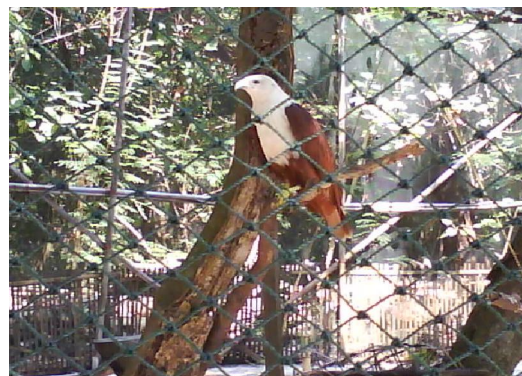
Gambar (Fig.) 4. Elang bondol ( Haliastur indus Boddaert) di Pusat Rehabilitasi Raptor, Kepulauan Seribu (Brahmury kite in the Rehabilitation Center, Pulau Seribu Islands)

P. Kotok yang memiliki luas paling besar tetapi pengelolannya dipegang oleh tiga pengelola sehingga pemanfaatannya juga terbagi tiga bagian. Kawasan yang disurvei adalah areal yang dikelola oleh NGO dan bergerak dalam pemeliharaan dan pelepasliaran burung elang bondol ( Haliastur indus Boddaert) dan elang ikan ( Pandion haliaetus L.) (Gambar 4). Di kawasan ini juga dijumpai burung bondol yang dilepasliarkan kembali berjumlah tiga individu. Di bagian lain yang dikelola sebagai tempat rekreasi banyak dijumpai burung gagak yang sangat menyukai sisa-sisa makanan di tempat sampah