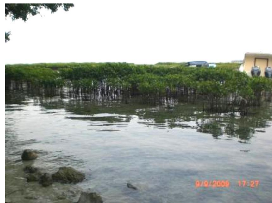
Gambar (Figure) 3 Pengayaan mangrove di TN. Kepulauan Seribu (Mangrove enrichment planting in Seribu Islands National Park)