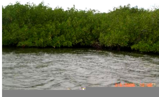
Gambar (Figure) 1. Hutan mangrove di TN Kepulauan Wakatobi (Mangrove forest in Wakatobi Islands National Park)

Vegetasi terestrial dan mangrove yang memiliki INP tertinggi yaitu bakau ( Rhizophora stylosa Griff), cemara laut ( Casuarina equisetifolia Linn), dan cemara udang ( Cupressus sp.). Hal ini berhubungan dengan keadaan tumbuhan yang tumbuhnya berkelompok dan terletak di perairan pasang surut dan pantai (Gambar 1). Beberapa jenis burung menyukai mangrove karena beberapa jenis vegetasi ini menyediakan pakan, tempat tidur, bersarang, dan menghindari dari predator daratan seperti kucing dan biawak (van Balen, 1989). Ekosistem mangrove menyediakan pakan ikan bagi burung raja udang ( Halcyon chloris Boddaert), burung pemakan serangga akan makan kumbang yang terdapat di bakau, dan burung pemakan madu dari suku Nectarinidae akan menghisap cairan dari bunga maupun pucuk tunas.