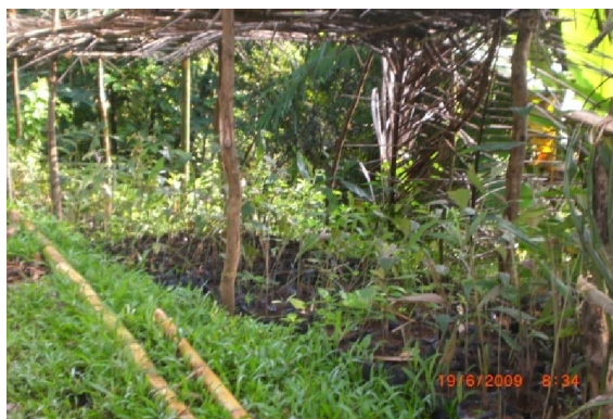
Gambar (Figure) 4. Pembibitan tanaman aren di kebun masyarakat Kp. Dengkleng, Ds. Sukamulya ( Aren nursery in community farm at Dengkleng Kampoang, Sukamulya Village )

gai bahan baku untuk gula aren. Di kawasan Gunung Halimun, gula aren yang dikenal ada dua, yaitu gula kojor dan gula semut (Kedai Halimun, 2002). Pohon aren secara konservasi berfungsi sebagai penahan air dan secara ekonomi dapat menjadi salah satu produk yang dapat meningkatkan pendapatan petani. Gula aren diperjualbelikan dengan harga Rp 10.000,- per kojor. Di samping itu usaha pembibitan tanaman aren telah mulai dilakukan di Kp. Dengkleng, Ds. Sukamulya untuk memenuhi kebutuhan bibit aren di desa sekitarnya, bekerjasama dengan Dishutbun (Gambar 4). Kegiatan ini dapat dikembangkan sebagai usaha alternatif dalam rangka memenuhi kebutuhan bibit tanaman, mengalihkan kegiatan perambahan hutan, dan meningkatkan pendapatan masyarakat.