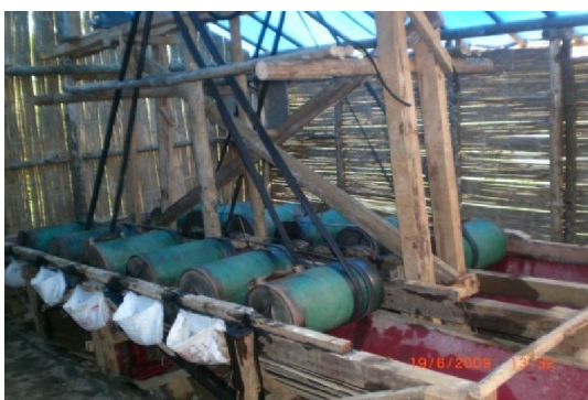
Gambar (Figure) 7. Gelundung, alat pengolahan emas ( Gelundung, as a tool of gold manufacture )

Jenis pekerjaan di rental gelundung atau tempat pengolahan tanah yang merupakan bahan baku emas terdiri dari penumbukan tanah dan pemberian air raksa (Gambar 7). Sistem transaksi yang diterapkan adalah sistem sewa untuk mengolah tanah per karung ditambah dengan pemberian air raksa. Gelundung diputar dengan bantuan listrik atau generator selama enam jam. Campuran tanah dan air raksa dialirkan ke air bersih untuk dipisahkan air raksanya. Butiran emas yang terkumpul dikumpulkan dan siap untuk dibentuk dan dijual.