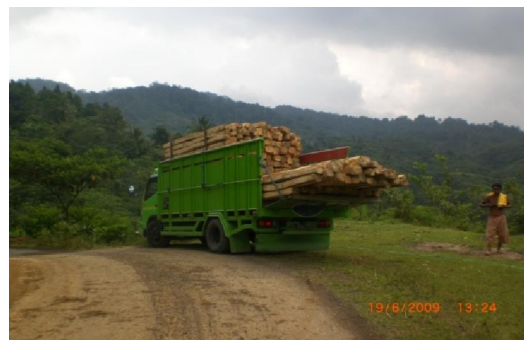
Gambar (Figure) 3. Pengangkutan kayu hasil panen di kebun masyarakat ( Transportation of harvesting wood in community farm )

Keragaman jenis buah-buahan yang dibudidayakan masyarakat sangat terbatas karena kekurangsesuaian tanaman terhadap iklim dengan curah hujan yang tinggi (4.000 mm/tahun) dan rata-rata ketinggian lokasi kebun 800-1.000 m dpl. Hal ini sangat berpengaruh terhadap pertumbuhan dan pembuahan. Tanaman buah-buahan yang dibudidayakan di dataran tinggi tersebut yang produksi buahnya cukup tinggi di antaranya adalah pisang, durian, dan manggis, sedangkan kecap buah-buahan sangat murah, biasanya kayunya yang dimanfaatkan untuk bangunan.