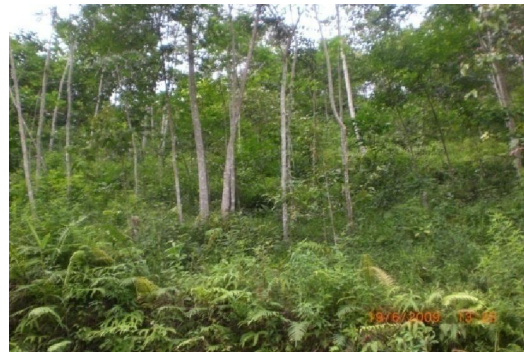
Gambar (Figure) 2. Tegakan jeunjing di kebun masyarakat ( Jeunjing stands in community farm )

pohon karena di hutan rakyat, jumlah tanaman jeunjing yang dianjurkan sebanyak 200 pohon/ha (Kartasubrata, 1989).