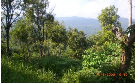
Gambar (Figure) 1. Kebun masyarakat Kampong Dengkleng, Desa Sukamulya ( Community farm of Dengkleng Kampong, Sukamulya Villages )

keh yang diborong dalam kebun seluas 500 m 2 dengan tanaman kurang lebih 10 batang, dengan hasil 10 karung atau sekitar 250 kg, dihargai Rp 500.000,00. Tanaman cengkeh yang ada seharusnya di-remajakan tetapi masyarakat lebih banyak memanfaatkan kebun cengkeh sebagai tempat pembuangan air bekas pengelolaan emas (Gambar 1).