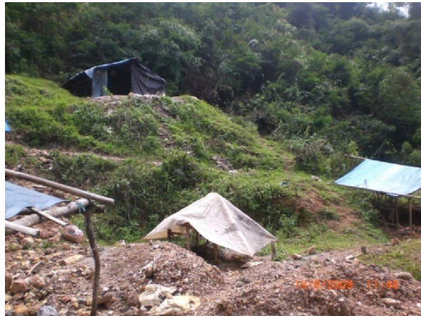
Gambar (Figure) 5. Lubang penambangan emas rakyat di Kampung Cirotan Atas, Desa Cihambali (Community gold well at Cirotan Atas Kampong, Cihambali Village)