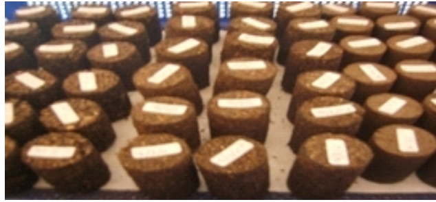
Gambar 1. Biobriket tempurung sawit Figure 1. Biobriquettes of palm shell

Tahapan proses penelitian dapat dilihat pada bagan Gambar 2.