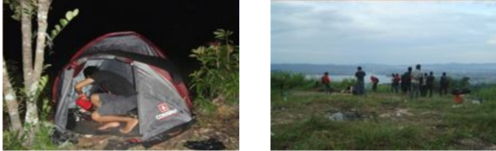
Gambar 2. Kondisi Arena Perkemahan/ Camping Ground Picture 2. Conditions Camping Ground

antaranya lintas alam, penelitian dan lain-lain. Adapun keadaan arena perkemahan dapat dilihat pada gambar berikut.