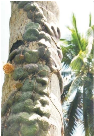
Lingkuba ( Dischidia imbricata Steud)