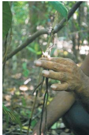
Rotan tikus ( Flagellaria indica L)