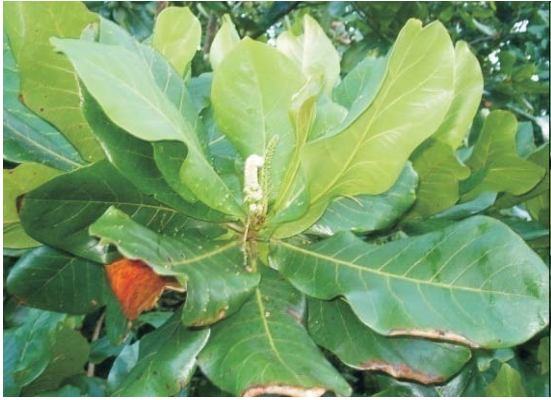
Ketapang ( Terminalia catappa L)

Appendix 1. Figure illustrating the forest plants indicatively potential ascancer drugs and otherinfectious diseases