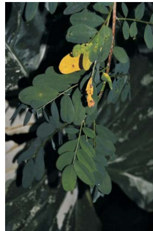
Luhu ( Crotalaria retusa L)