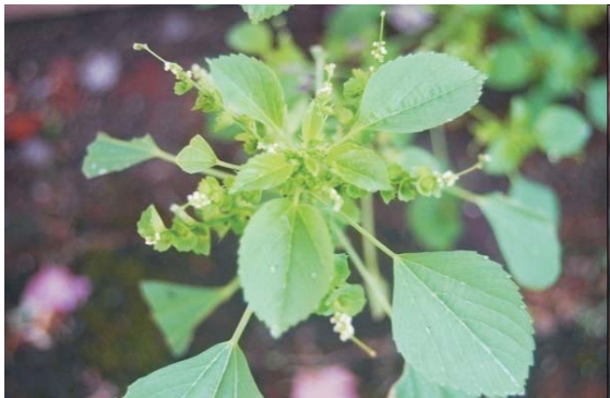
Cakar kucing ( Acalypha indica L)