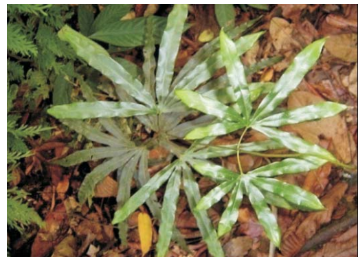
Kayu gimto ( Ligodyum sp.)