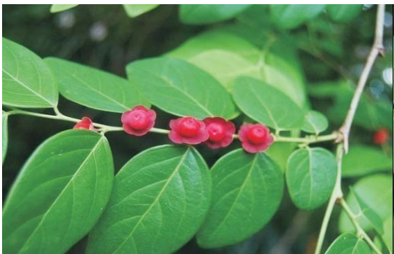
Nanamuha ( Bridelia monoica Blume)