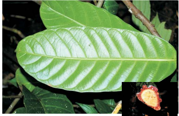
Tanduk rusa ( Tendrils lianas )