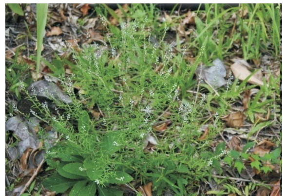
Rumput balsam ( Polygala paniculata L)