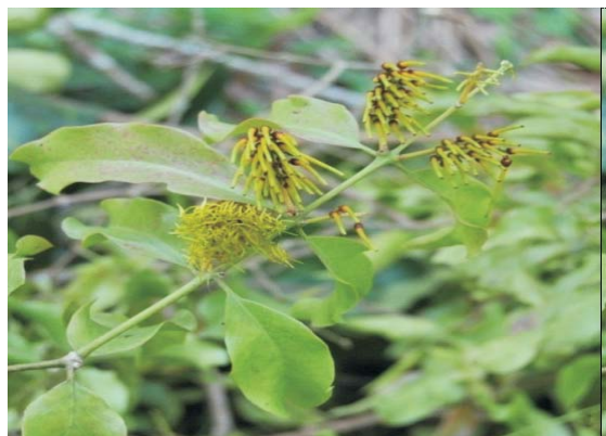
Loranthus globulus Jacq