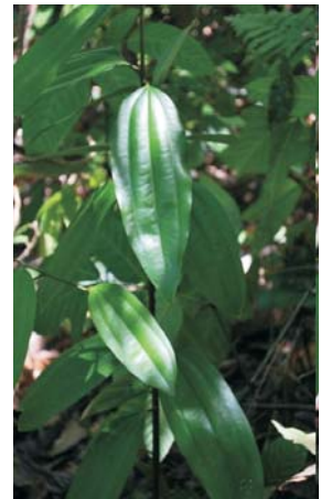
Kayu lawang ( Cinnamomum cullilawan Bl)