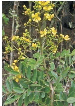
Kuhung-kuhung ( Crotalaria striata Dc)