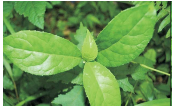
Yantan ( Blumea chinensis Dc)