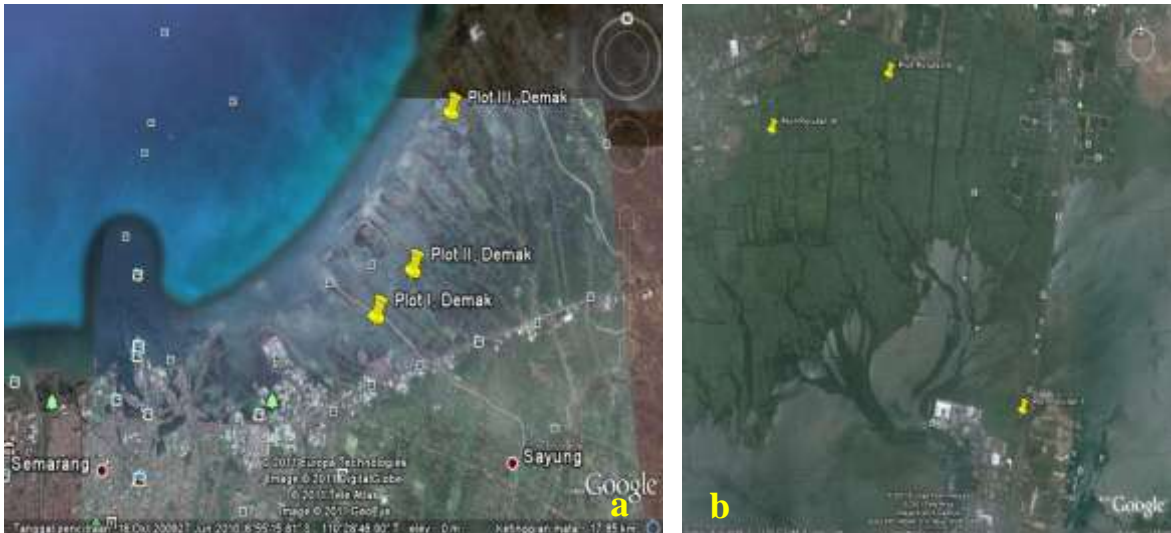
Gambar (Figure) 1. Lokasi penelitian di hutan mangrove: (a) Demak, (b) Denpasar (Research sites of mangrove forest: (a) Demak, (b) Denpasar)