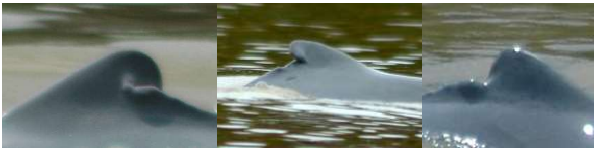
Gambar (Figure) 2. Foto sirip punggung pesut yang diambil secara ‘perpendicular’ ( Dolphin’s dorsal fin That was captured perpendicularly )

Dalam setiap riset, ketika terjadi perjumpaan dengan individu/kelompok pesut, semua individu “ditangkap dan ditandai” dengan mengambil foto sirip punggungnya. Foto sirip punggung diambil secara “perpendicular” (Gambar 2) atau tegak lurus bi-dang sirip (Kreb, 2004; Beasley, 2007; Sutaria, 2009).