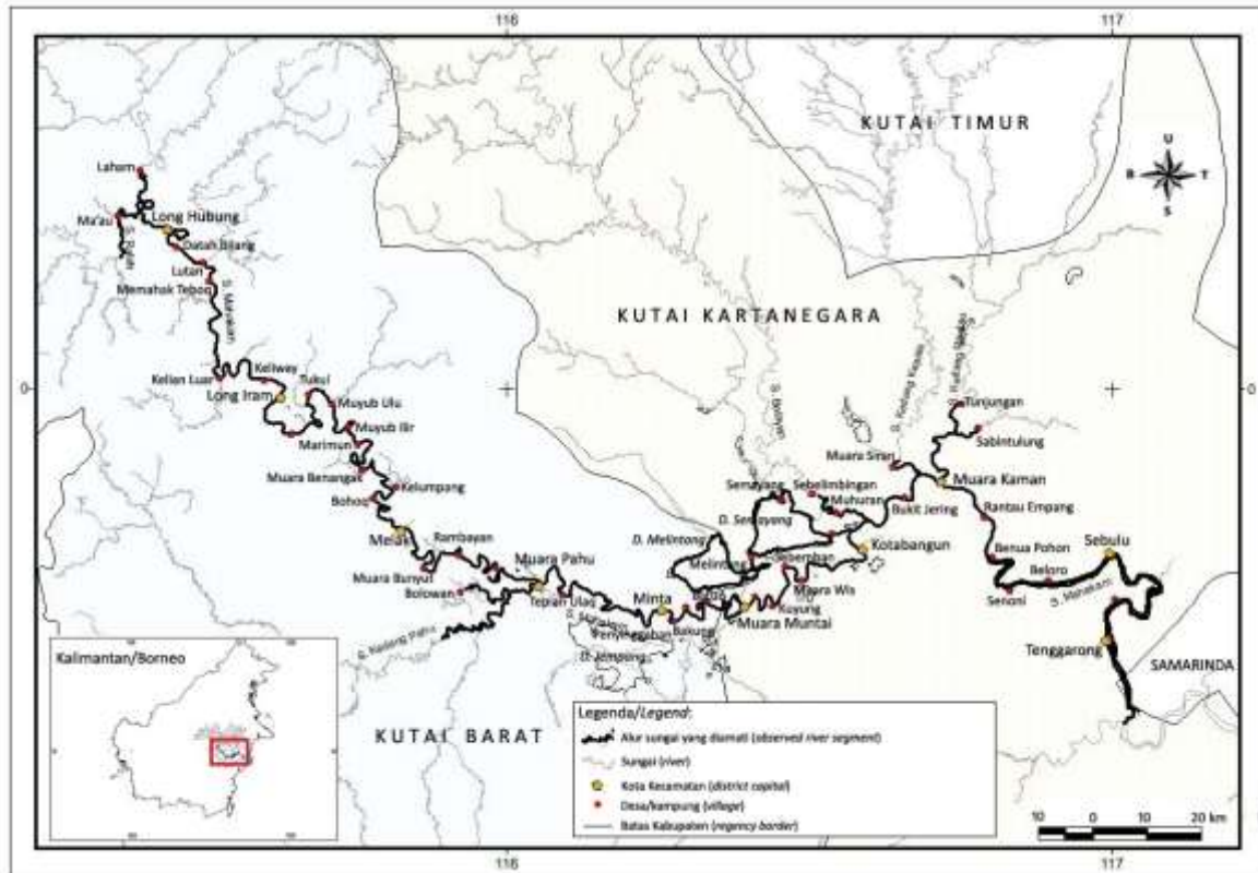
Gambar (Figure) 1. Peta lokasi penelitian ( Map of research location )