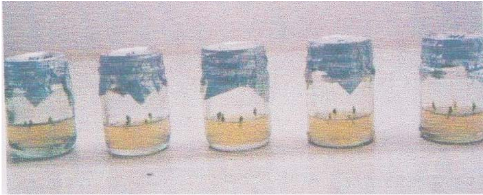
Gambar (figure) 1. Eksplan yang ditanam pada media M 5 0 ( Explants were planted on MS0 medium )