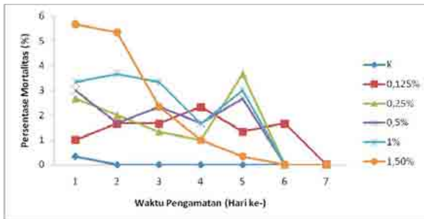
Gambar (Figure) 2. Rata-rata persentase mortalitas larva perlakuan ekstrak umbi gadung pada berbagai taraf konsentrasi selama tujuh hari pengamatan ( Mean of P. plagiophleps mortality observed for seven days on extract treatment of 'gadung' tuber )