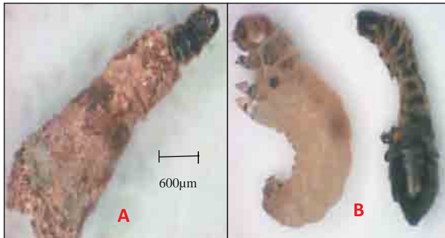
Gambar (Figure) 1. a) Ulat kantong yang mati ( The dead larvae ), b) Larva yang hidup dan mati ( Larvae and the dead larvae )