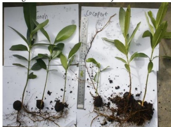
Gambar 1. Penampilan bibit dari media tanah (kiri) dan serabut kelapa (kanan)

Media semai merupakan komopenen utama dalam pembuatan tanaman. Media memiliki kandungan organik dan sifat fisika-kima yang berbeda – beda. Hal ini berpengaruh terhadap proses aerasi dan drainase, sehingga akan berpengaruh terhadap karakteristik pertumbuhan suatu tanaman. Pemilihan kedua jenis media yang dipakai dalam penelitian ini adalah dasar pemilihan media yang lebih mudah ditransportasikan, biaya dan efisiensi penyiraman dan pemupukan. Gambar 1 menunjukkan karakteristik bibit nyamplung dari 2 media, sedangkan secara kualitatif ditunjukkan Tabel 1.