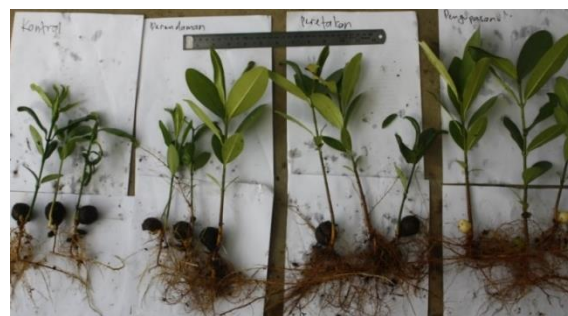
Gambar 2. Penampilan bibit dari perlakuan kontrol, perendaman, peretakan dan pengupasan

Menurut Suryawan et al. (2014) untuk mendapatkan viabilitas benih nyamplung yang tinggi membutuhkan perusakan cangkang atau pengupasan. Hal ini agar air mampu mencapai benih. Perlakuan yang diberikan tentunya harus berhati-hati karena benih didalam bisa mengalami kerusakan. Berdasarkan hasil ujicoba 1, ujicoba ini menggunakan media cocopeat . Berikut kenampakan bibit nyamplung yang dihasilkan pada bulan ketiga berdasarkan penanganan benih (Gambar 2) dan hasil rekapitulasi analisis sidik ragam (Tabel 2).