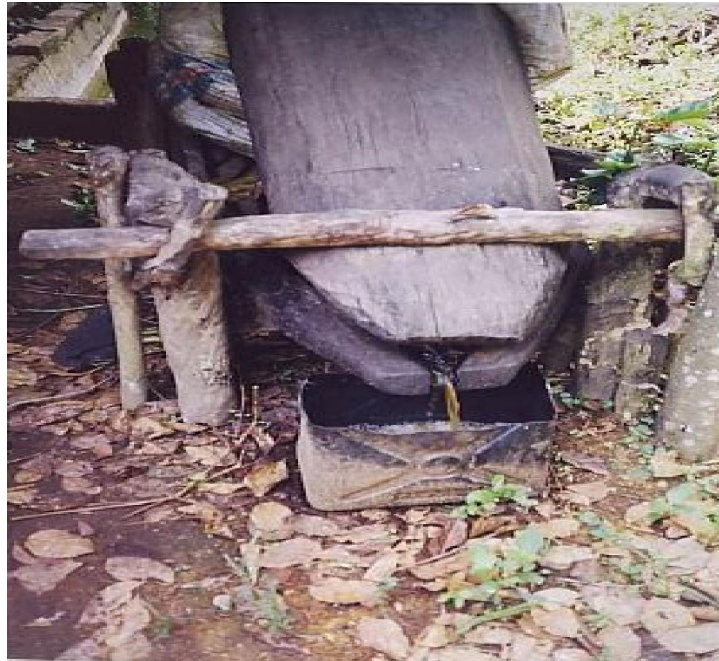
Gambar 2. Alat kempa daun gambir Figure 2. Pressing tool for gambir leaves